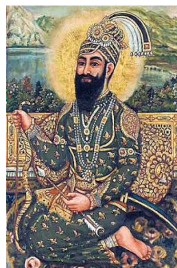
Guru Gobinde Singh 1