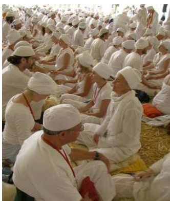
beim weißen Tantra 1